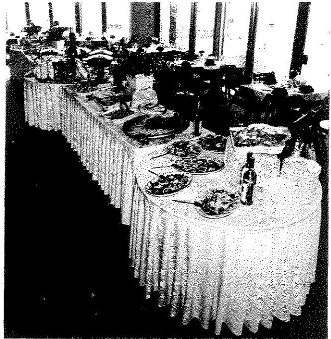
מאכלים כיד המלך אף הם חלק מהעיר האוניברסלית

מעט יותר יומיומי, אך לגמרי לא מקומי, הוא בעל הטור "יומנו של עירוני מסתלבט" (11 בדצמבר 1987), הנהנה מדי בוקר מ"קפה עם