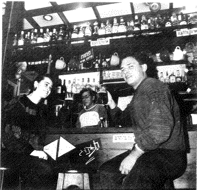
פאר תל אביבי

מעניין לגלות ב"העיר" כי הקולנוע הבין לאומי, הנחשב לאיכותי ובשל שתי עובדות אלה — לאוניברסלי, משמש מודל להזדהות לא רק עבור קולנוענים מקומיים, כי אם גם עבור יזמי בינוי וארכיטקטורה תל אביבים. הנה בני קבוצה משפחתית, קיי-קיסילוב, המהווים על פי תפיסתם קומונה לבניין וסופגים השראתם מקליפורניה ומיפן — "אומרים שאולי הם כמו האחים טביאני" (18 בדצמבר 1987). יוצרי קולנוע איטלקים אלה ביימו סרטים הנחשבים על ידי אנשי המקצוע כיצירות מופת, ביניהם סרטים כמו "פדרה פדרונה" ו"כאוס".