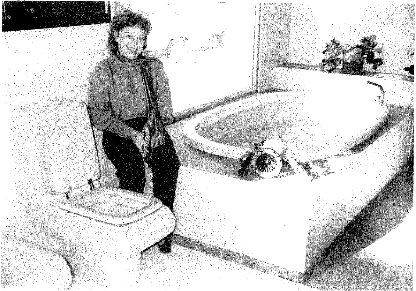
לקווי במקלחת. לפי שעה עדין ללא טלוויזיה

והלהיטים של אתמול כבר נרקבים במחסנים. "ובסיכום, "השוק הישראלי מתנהג כאילו היה לפחות ראול א'קארלי, כלבו הבשמים היוקרתי בפאריז."